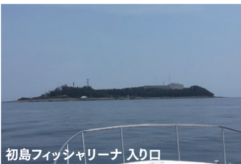
初島フィッシャリーナ 入り口